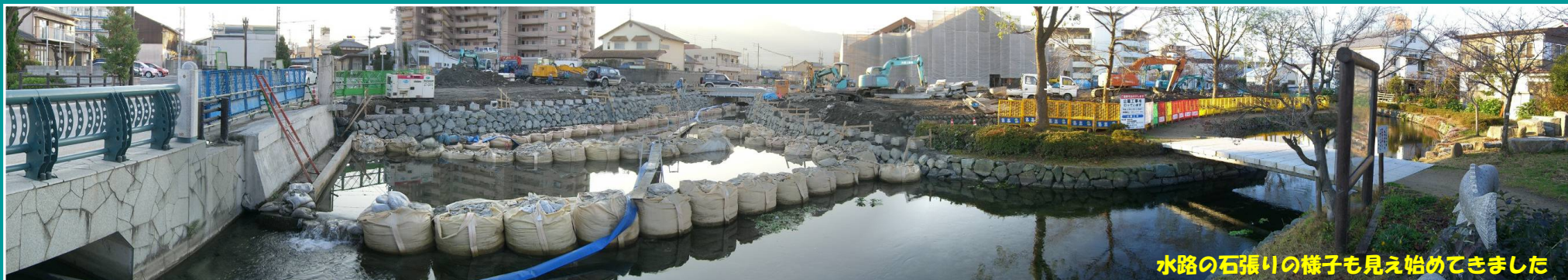
水路の石張りの様子も見え始めてきました