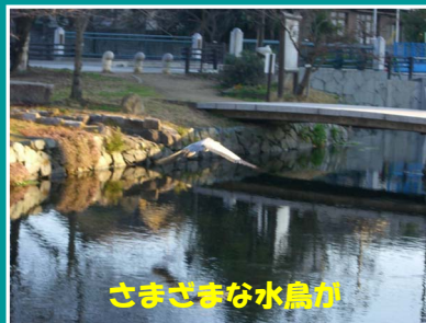
さまざまな水鳥が