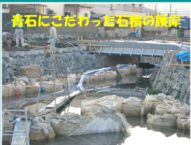
青石にこだわった石積の護岸