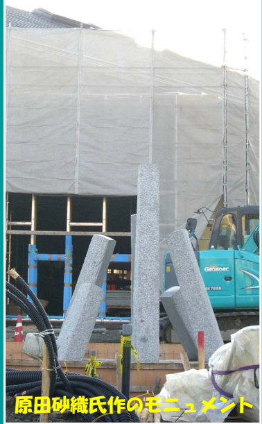
原田砂織氏作のモニュメント