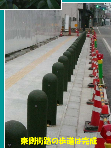
東側街路の歩道は完成